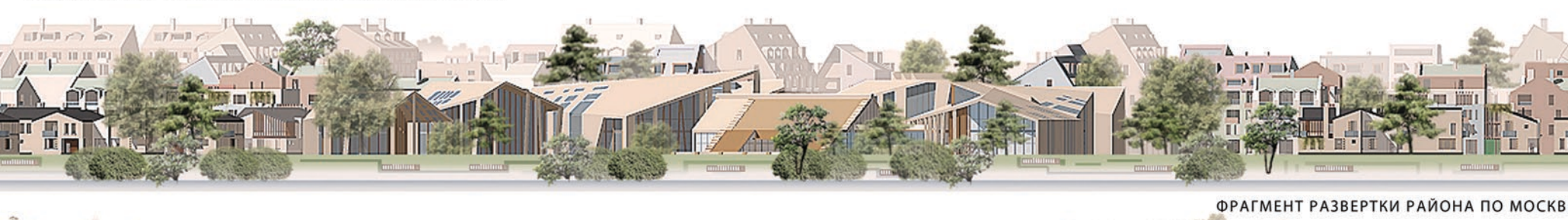
ФРАГМЕНТ ЗАСТРОЙКИ РАЙОНА ПО МОСКВЕ-РЕКЕ