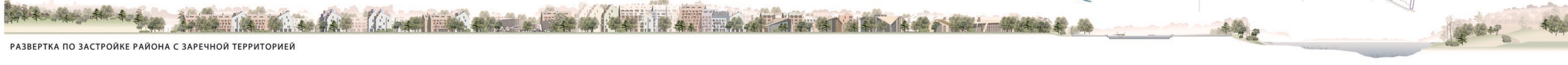
РАЗВЕРТКА ПО ЗАСТРОЙКЕ РАЙОНА С ЗАРЕЧНОЙ ТЕРРИТОРИЕЙ