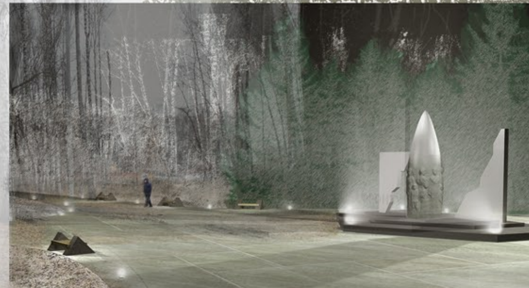
вид справа с элементами благоустройства