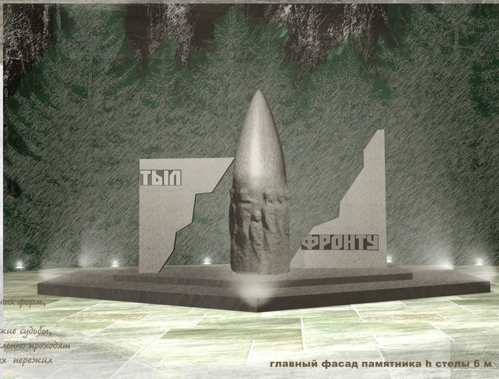
главный фасад памятника h стелы 6 м

Эмоциональная и информационная грань жизни тех суровых лет существует поныне в письмах- треугольниках военной полевой почты. Эти письма хранятся, как особенная реликвия.